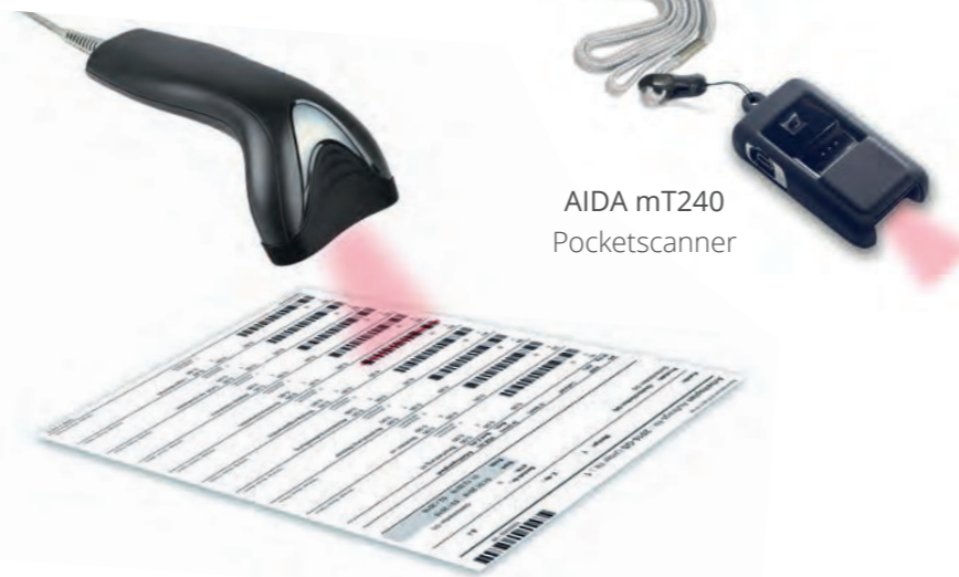
AIDA mT240 Pocketscanner