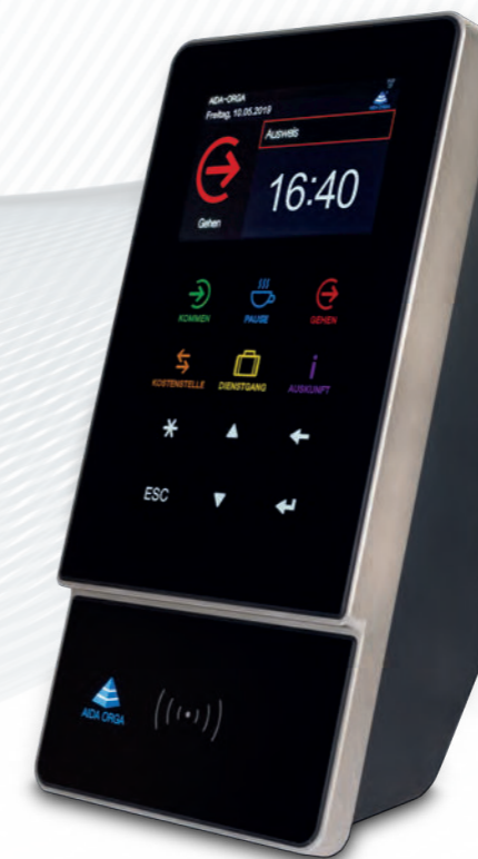
AIDA T1635 für Zeit, Zutritt und Kostenstellenwechsel