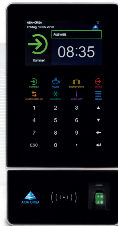
AIDA T1637 für Zeit, Zutritt und Kostenstellenwechsel