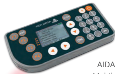
AIDA mT610 Mobilcomputer