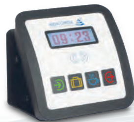
AIDA T40 für Zeiterfassung und Kostenstellenwechsel