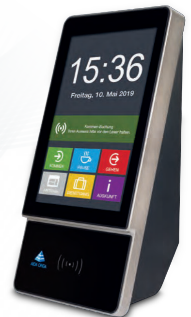
AIDA T1670 für Zeit, Zutritt und Web-Self-Service