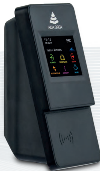
AIDA T1625 für Zeit, Zutritt und Kostenstellenwechsel